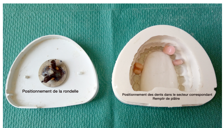
Fig 3: moules en silicone, attention au positionnement des dents !